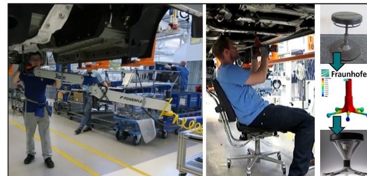
Abb. 2: Maßnahmenbeispiel: 3-Arm, Unterbodensitz, Leichtbauhocker